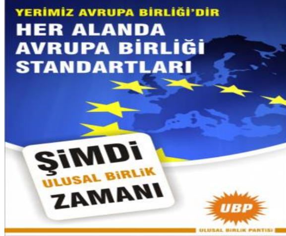
UBP Seçim Afışı

gerektiğini “ulusal temelli Avrupa” söylemi içerisinde savunmuş 68 , bununla birlikte Avrupa Birliği uyum sürecini “idari reformlar” ile eşleştirmiş ve kamu/mali reformunda öncü imajı vermeye çalışmıştır. Bu bağlamda 2009 yerel seçimlerine Avrupa Birliği bayrağı ve Avrupa haritası içeren görsellerle katılmış, “Yerimiz Avrupa Birliğidir” çağrısında bulunmuş ve “her alanda Avrupa Birliği standartları” sözü vermiştir.