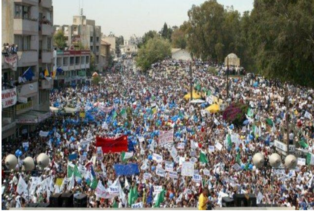
14 Ocak 2003 tarihinde Lefkoşa'da İnönü Meydanında düzenlenen mitingden bir kare.

çözümün gerçekleşmemesi ve adanın bölünmüş bir şekilde Avrupa Birliği'ne girmesi halinde, Kıbrıs Türk toplumunun uluslararası alanda tecrit edileceğini ve bölünmüşlüğü kalıcılaşacağını savunmuştur. CTP bu dönemde, Cumhurbaşkanı Denктаş'ı hedef alarak, "taksim" politikası izlemekte olduğunu ifade etmiş ve Cumhurbaşkanı'nı "sultanlık" sürdürmekle suçlamıştır. 39 Dahası mevcut çözümsüzlük durumunu ve Türkiye ile olan ilişkileri kimliğe atıfla tehdit unsuru haline getirmiş ve çözüme bağlı Avrupa Birliği üyeliğini bir "kurtuluş" olarak kurgulamıştır.