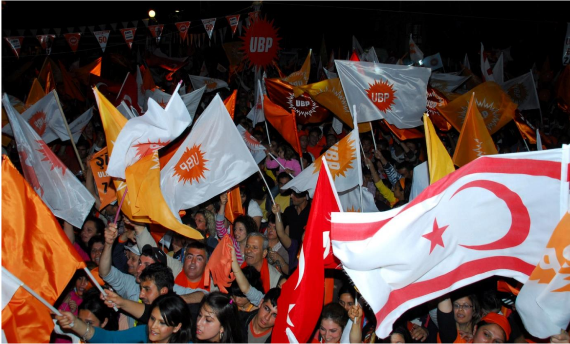
AB'nin tehdit olarak yüklememesi UBP'nin referandum sonrası söylemsel düzleminde görülmemektedir.

Bu durumun 2004 yılından itibaren oy kaybına uğrayan (bkz. Ek 1) partinin seçim kaygılarından kaynakladığı söylenebilir. Buna ek olarak referandum sürecinde "Annan Planı"na hararetle karşı çıkan UBP ile 2002 yılında Türkiye'de iktidar olan ve Annan Planı'nın genel çerçevesini oluşturan gevşek bir federasyon modelini destekleyeceğinin sinyallerini veren AKP hükümeti ile ilişkilerin düzeltilmesi arzusunun da önemli bir rol oynadığı düşünülebilir.