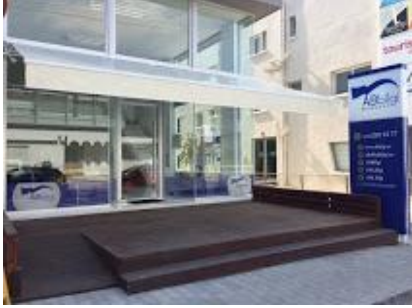
Lefkoşa'da bulunan Bilgi Merkezi, AB'nin görsel sembollerinin azlığı ile de dikkat çeker.

Yukarıda belirtilen çerçevede, AB'nin Kuzey Kıbrıs ile kurduğu ilişki "kısıtlı" olarak değerlendirilebilir. Ancak özen gösterilmesi gereken nokta, kısıtlı ilişkiye rağmen "Avrupa" ve "Avrupa Birliği" tasvirlerinin günlük siyasal söylemlerde önemli bir rol oynamakta olduğudur. Bu çerçevede Avrupa Birliği ve Avrupa söylemsel bir pratik olarak kavramsallaştırılmaktadır. 23 Avrupa Birliği'nin aday ülkeler üzerinde kurduğu siyasi koşulluluk, aynı zamanda siyasi partilerin fırsat yapılarına ve fırsat pencerelerine karşı takınacakları olumlu veya olumsuz tutumlar geniş bir söylemsel alanın oluşmasına imkân tanımaktadır. 24 Nitekim söz konusu söylemsel alanın varlığı, gerek Kıbrıs-Avrupa ilişkileri, gerek Avrupalılaştırma literatüründe karşılığını bulmuştur.