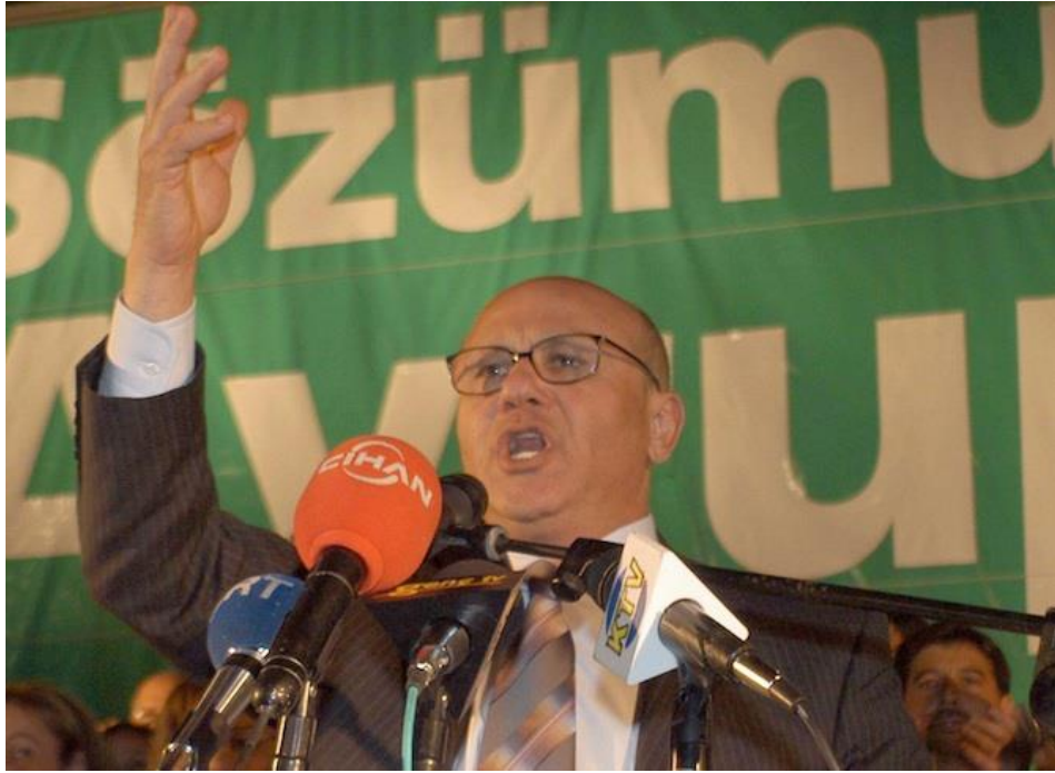
Dönemin CTP Lideri, 2. Cumhurbaşkanı Mehmet Ali Talat'ın Şubat 2005 seçimleri sonrası zafer konuşması; arka plandaki görselde CTP'nin seçim kampanyası sürecinde kullandığı "Sözümüz var Avrupa'ya" sloganı yer almıştı.

Avrupa Birliği üyeliği, ilk bakışta Adadaki Kıbrıslı Türkler ve Kıbrıslı Rumları etnik milliyetçi temelde süregelen çatışmanın ötesine taşıyabilecek ulus ötesi bir düzlemde inşa edildiği düşünülmektedir (ki bunun neden sorunlaştırılması gerektiği ilerleyen bölümlerde açıklanacaktır). Özellikle 2000'li yılların başında ve 2002 yılında yapılan Kopenhag Zirvesi öncesinde yükselişe geçen bu söylem, CTP'nin 2003 yılında iktidara gelmesinden sonra zirve yapmıştır.