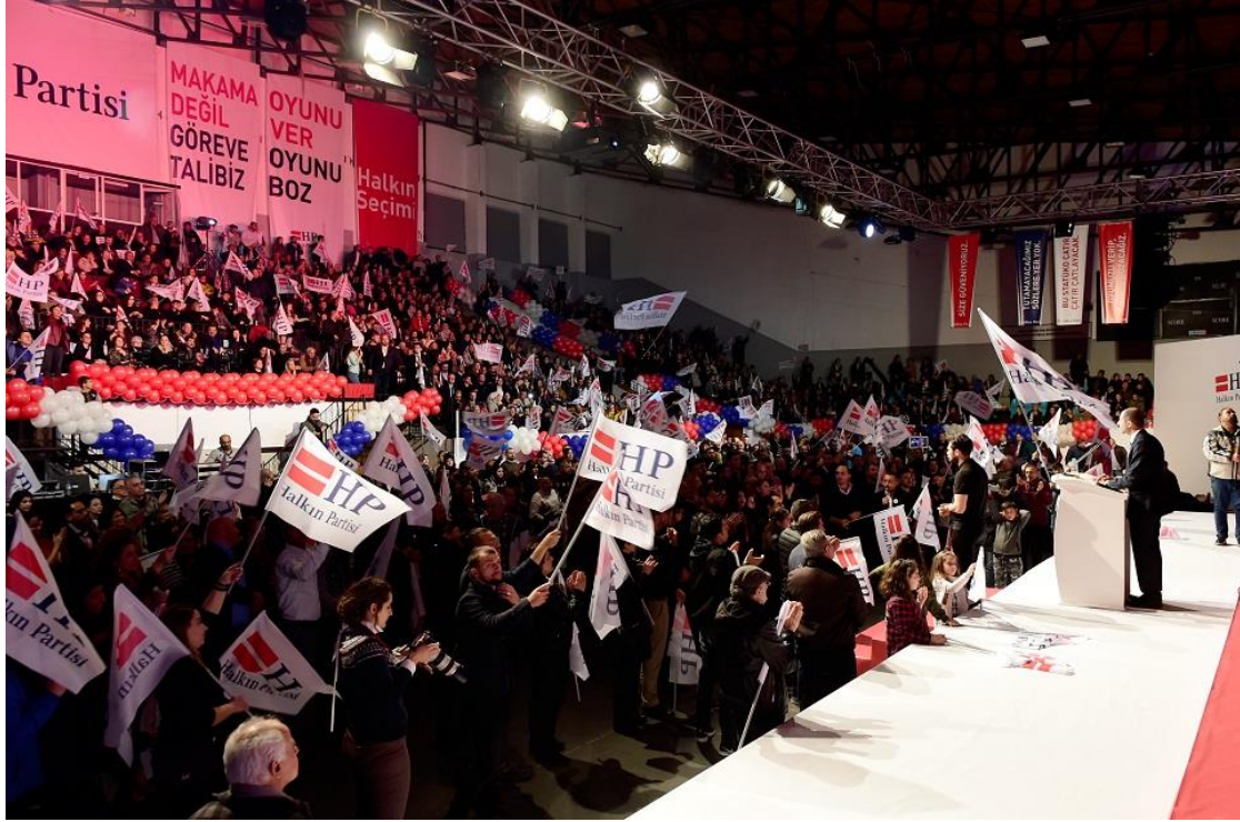
Halkın Partisi'nin Ocak 2018'de Lefkoşa'da düzenlediği "Şölen"den bir kare.

İşte bu sebeple, yani "ideolojiden arınma" galesi Halkın Partisi'nin kullandığı söylemin AB normlarına referansla meşrulaştırılması noktasının en azından şu an için parti açısından öncelikli olduğu ve bu yüzden AB'ye yönelik "kaba milliyetçi" açıklamalardan veya AB'ye atıfla sol ile özdeşleştirilen Kıbrıslılık şiarından sakınacağı düşünülebilir. Ancak burada vurgulanması gereken nokta, HP' nin sakınmaya çalışsa da söyleminde ürettiği Avrupa vizyonunun, en azından KKTC'de de uygulamayı öngördüğü politikalarda temel aldığı Avrupa içerisindeki neo-liberalizm ve idari reform ilişkisinin ideolojik olduğudur.