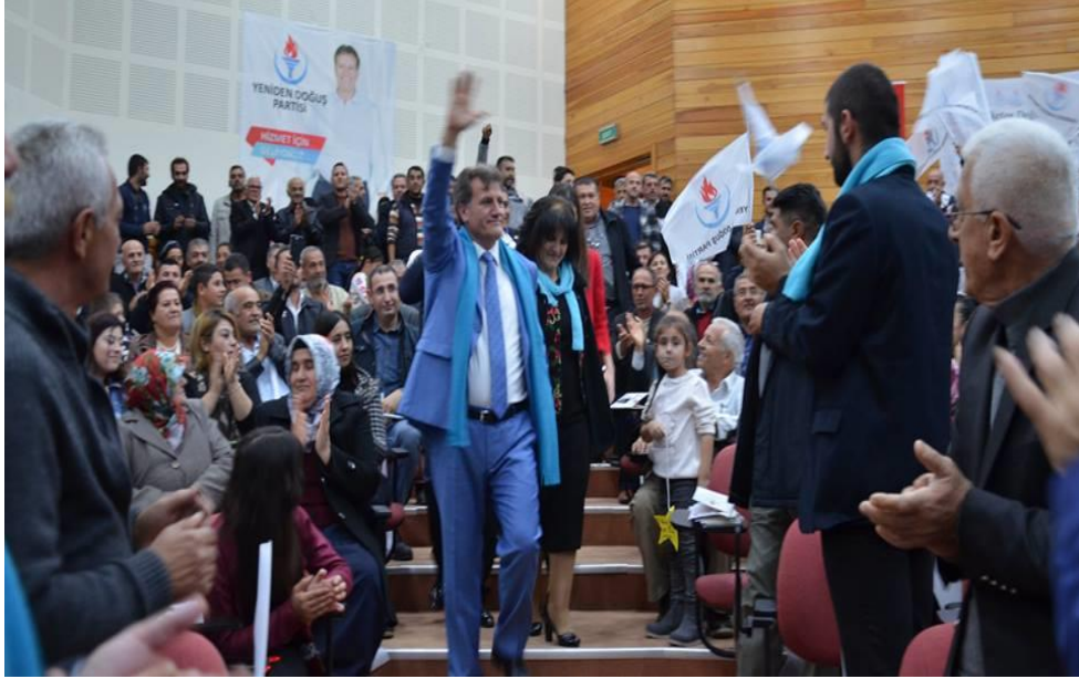
Yeniden Doğu Partisi Başkanı Erhan Arıklı, Aralık 2017’de düzenlenen “Aday Tanıtım Şöleninde” partilileri selamlıyor.

Diğer taraftan Ocak 2016’da akademisyen ve eski müzakereci Kudret Özersay tarafından kurulan ve merkezci bir temelde kendisini konumlandıran Halkın Partisi (HP), söylemlerinde “yeni bir siyaset anlayışı” teması kullanmıştır. “Köklü değişim”, “insan hakları”, “demokrasi”, “laiklik”, “sosyal adalet”, “şeffaflık”, “hesap verebilirlik”, “liyakat” ve “hukukun üstünlüğü” gibi referans sözcükler temelinde geliştirilen parti söylemi Kıbrıs müzakereleri konusunda da kurguladığı yeni siyaset anlayışının “hem BM parametrelerindeki çözüme, hem de Avrupa Birliği ile bütünleşmeye uygun hale getirilmesine yardımcı olacağını” vurgulamaktadır. 73 Bu öngörüyle Aralık 2017 seçimleri için hazırlanan HP manifestosunda yer verilen temel politikalar da Avrupa normlarına atıfla meşrulaştırılmıştır. Bu noktada altı çizilmesi gereken önemli bir husus Avrupa söyleminde HP’ nin henüz ideolojik referanslara başvurmamasıdır. Diğer partiler ile karşılaştırıldığında ortaya çıkan bu farklılık, partinin geleneksel sağ ve sol söylemlerden sıyrılmaya çalışan “yeni bir KKTC” tahavvülüdür. Nitekim parti programında kullanılan referanslar ve “temiz, dürüst, objektif siyaset ve yönetim” iddiası, partinin ideolojik yüklenimlerin ötesinde “hakikatlerin” temsilcisi gibi davranabilme çabasıdır. 74