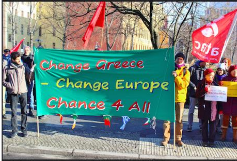
Yunanistan'da 2008 yılından itibaren baş gösteren kriz, kıta genelinde AB mali ve idari politikalarına yönelik eleştirileri de beraberinde getirmiştir.

Bu söylemin önemli bir özelliği, ağırlıklı partilerin “kolayca uzlaşabildiği” 62 veya hedef birliği gösterdiği konuların ( valence issues ) vurgulanmasıdır. Bu bağlamda Avrupa Birliği söylemi, kamu sektörünün ve mali bütçenin etkinliği, uluslar arası piyasalara erişim, denk bütçe) gibi pozitif anlamlar yükleyen gösterenler ( signifiers ) ile söylemsel düzlemde Avrupa Birliği üyeliğinin pozitif temsili sağlanmaktadır. Bu noktada vurgulanması gereken diğer bir husus da ideolojik görünmeyen bu söylemin aslında ideolojik olduğudur. Çünkü Avrupa “karşı durulamayacak küreselleşme süreci” 63 hakim anlayışı üzerinden kurgulanıp Avrupa içerisindeki neo-liberalizm ve idari reform ilişkisi veya AB'nin aday ve üçüncü ülkelerle olan ilişkilerini sorunlaştıran alternatif anlatılar dışlanmaktadır. 64