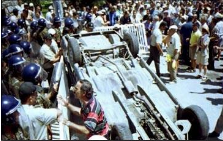
2000 yılında patlak veren Bankalar Krizi neticesinde binlerce kişi mağdur olmuş, mudiler polisle çatışmıştı.

Aradan geçen kısa zamana rağmen, 8 Kasım 2001 tarihinde Rauf Denктаş, Kıbrıslı Rum Lider Glafkos Klerides'e mektup göndererek Ada'da yüz yüze görüşme önerisinde bulunmuştur. Bu çerçevede Denктаş ve Klerides 4 Aralık 2001'de ara bölgede bir araya gelmiş ve 2002 yılı ortalarında doğrudan görüşmeleri başlatma kararı almışlardır. Görüşmelerde yaşanan bu gelişmelere paralel olarak Kuzey'de patlak veren 1999-2000 bankalar krizi ile ciddi bir ekonomik bunalım yaşayan Kuzey Kıbrıs'ta büyüyen tepkilerin de Kıbrıs Türk tarafının masaya dönme kararında etkili olduğu söylenebilir. 13